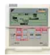
簡単コントローラー