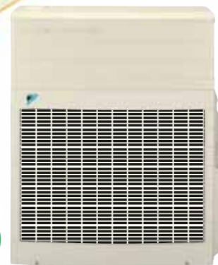
室外ユニット 1MUS502DFV (2ゾーン運転あり) 希望小売価格 435,750円(税込)