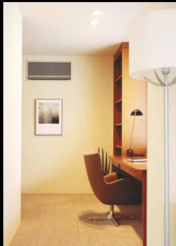
フラットに納まるから、ライティングにこだわった住まいでも室内イメージを損ないません。

エアコン本体を天井や壁に埋め込むので、圧迫感のないすっきりとした印象の仕上がりに。インテリアや室内の雰囲気を損なうことなく快適な空調を行います。