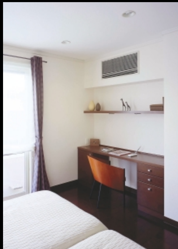
本体が露出しないため圧迫感がなく、インテリアとも自然な雰囲気で調和します。