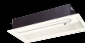
天井埋込カセット形 エアコン本体を天井裏に隠して設置するタイプ。シングルフロー(1方向吹出し)とダブルフロー(2方向吹出し)があります。