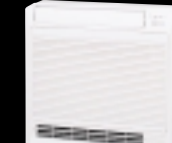
床置形 床に置いたり、窓下の壁に埋め込んだりできるタイプ。上下2方向の吹出しで、足元を中心にお部屋全体をムラなく快適にします。