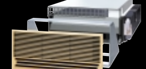
アメニティビルトイン形 部屋の構造に合わせて壁や天井に柔軟に設置できるタイプ。吸込口と吹出口を分けての設置や、吹出口を複数ヶ所設けた設置も行えます。