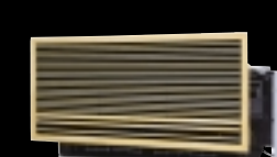
壁埋込形 エアコン本体を壁の中に埋め込むタイプ。幅785cmのコンパクト設計なので、和室の狭い小壁にも対応。洋風グリルを使えば洋室の雰囲気にもぴったりです。