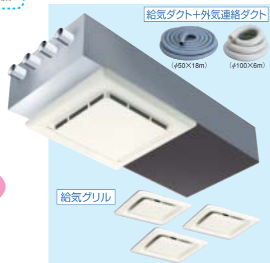
標準システム 断熱空間用 (非断熱ダクトシステム) VH15BSD ※光クリーン換気ユニット、給気グリル、給気ダクト+外気連絡ダクトのセットシステム希望小売価格 165,900円 (税込)

*常時発生し続ける臭い成分 (建材臭、ペット臭など) のすべては除去できません。