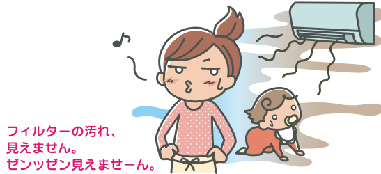
フィルターの汚れ、 見えません。 ゼンッゼン見えませーん。